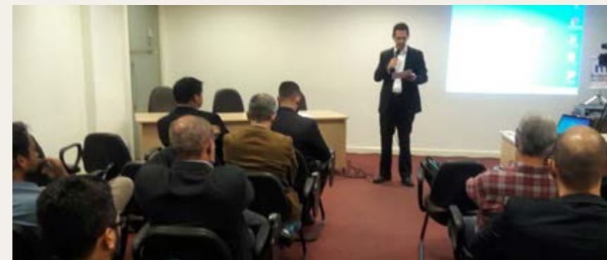
Reuniões em BH diversificaram conteúdo