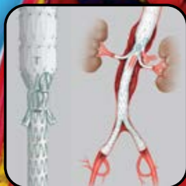
Zenith Toraco-Abdominal t-Branch