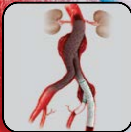
Zenith Flex AAA com Zenith ZBIS Ramificada Ilíaca