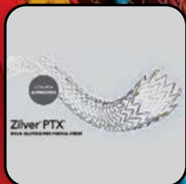
Stent Farmacológico Zilver PTX