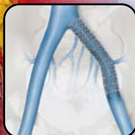
Stent Venoso Vena