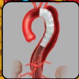
Zenith ZDEG com Dissection