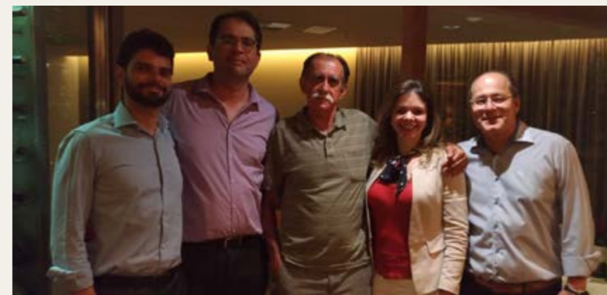
Encontro em Uberlândia garantiu confraternização entre os colegas