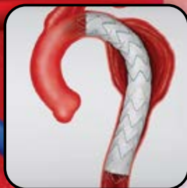
Zenith Alpha Torácica Baixo Perfil